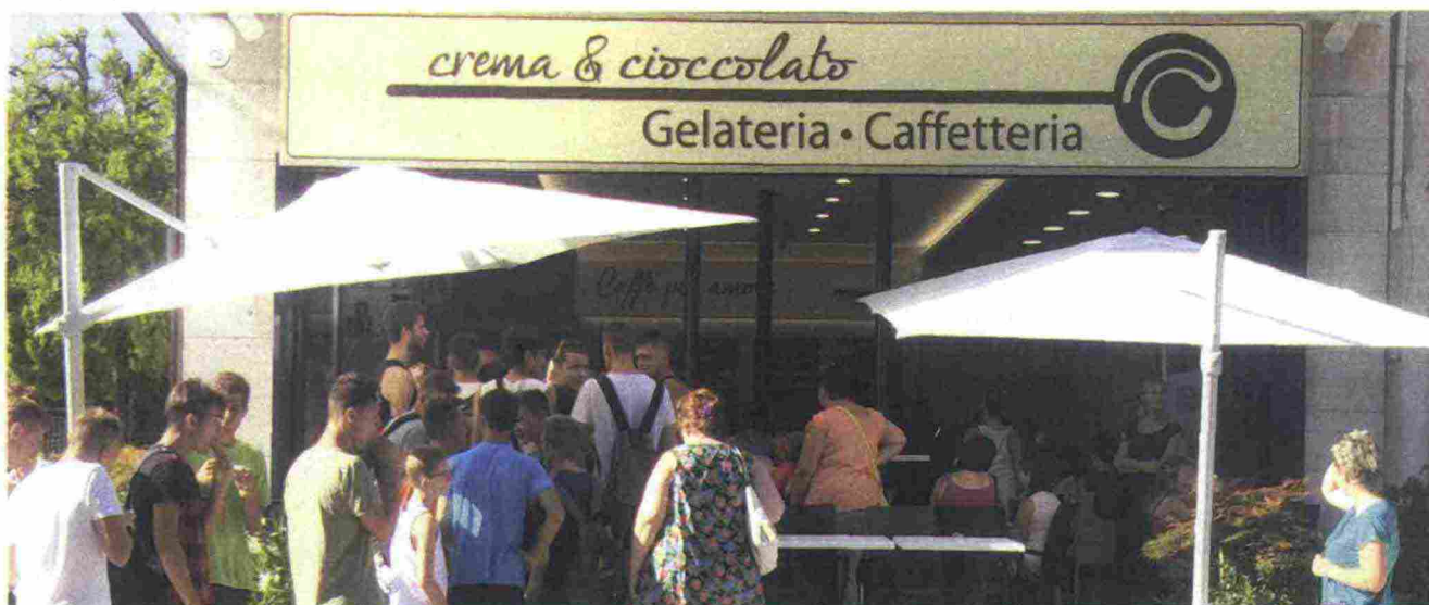
Uno dei 400 punti vendita Crema & Cioccolato

HANNO FATTO CARRIERA PARTENDO DAL LAVORO IN GELATERIA; OGGI SONO MANAGER DI CREMA & CIOCCOLATO: IL FRANCHISING PIÙ AMPIO D'ITALIA.